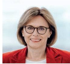
Susanne Kraus-Winkler Staatssekretärin für Tourismus

„Der Tourismus zählt zu den zentralen Stützen der heimischen Wirtschaft. Die traditionelle Gastfreundschaft, hervorragende Kulinarik und einzigartige Natur sind besondere Alleinstellungsmerkmale der Urlaubsdestination Österreich. Die Verhaltensregeln auf Almen und Weiden leisten einen wichtigen Beitrag, damit dies auch in Zukunft so bleibt.“