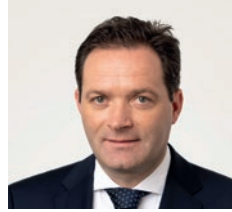
Norbert Totschnig Bundesminister für Land- und Forstwirtschaft, Regionen und Wasserwirtschaft

„Hinter dem einzigartigen Urlaubserlebnis in Österreichs Bergen stecken die harte und traditionsreiche Arbeit unserer Almbäuerinnen und Almbauern. Zehn klare Verhaltensregeln erhöhen die Sicherheit und helfen Konflikte zu vermeiden. Unser Ziel ist es, dass die Bäuerinnen und Bauern ihren Tätigkeiten nachgehen, bzw. die Gäste sich wohlfühlen können.“