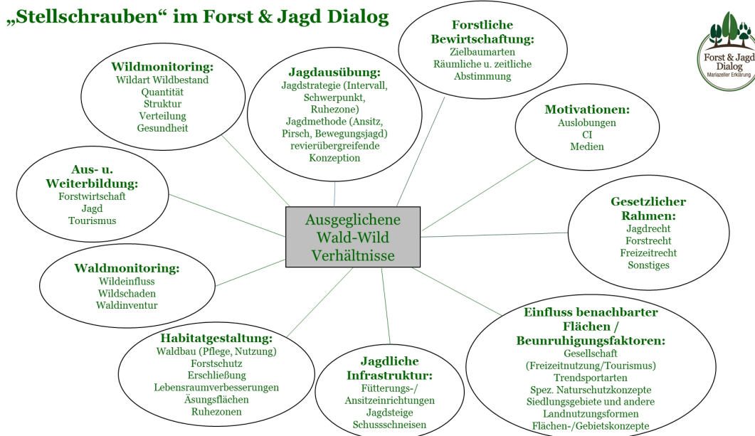
Abbildung 3: Forst & Jagd-Dialog – „Stellschrauben“

Für den Bereich „Motivation, Kommunikation und Öffentlichkeitsarbeit“ wird eine Kommunikationsstrategie weiterentwickelt und laufend umgesetzt.