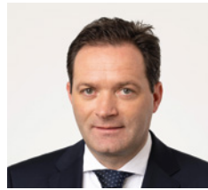
Norbert Totschnig Bundesminister für Land- und Forstwirtschaft, Regionen und Wasserwirtschaft

” Hinter dem einzigartigen Urlaubserlebnis in Österreichs Bergen stecken die harte und traditionsreiche Arbeit unserer Almbäuerinnen und Almbauern. Zehn klare Verhaltensregeln erhöhen die Sicherheit und helfen Konflikte zu vermeiden. Unser Ziel ist es, dass die Bäuerinnen und Bauern ihren Tätigkeiten nachgehen, bzw. die Gäste sich wohlfühlen können. “